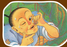
陳怡真文、楊翠玉圖(2003)。 《李田螺》·台北：遠流。