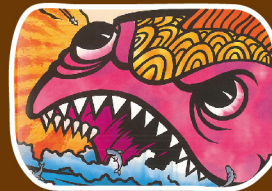
張子媛文、李漢文圖(2006)。 《女人島》·台北：遠流。