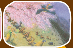
嚴淑女文、張又然圖(2003)。 《春神跳舞的森林》·台北： 格林。