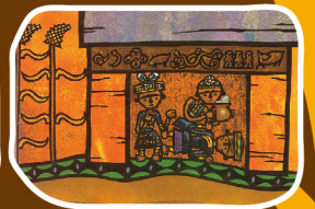
嚴琴琨文、李漢文圖(2006)。 《仙奶泉》·台北：遠流。